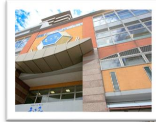
天平のまちオフィス